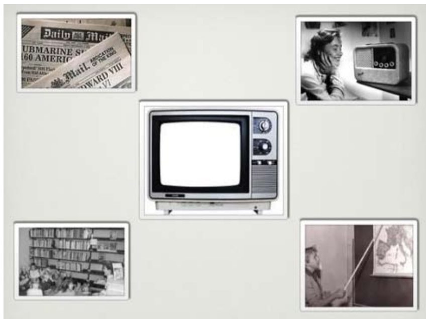
Her ser du en illustrasjon som viser biblioteket, TV (sort hvit), Kurer radio, nedtrekkbart kart på skolen og aviser. Dette var hva skolen hadde å støtte seg til den gangen.

sendingene deres på en Tandberg spolebåndspiller og brukte neste dag til å høre igjennom og spille sammen med den nye musikken.