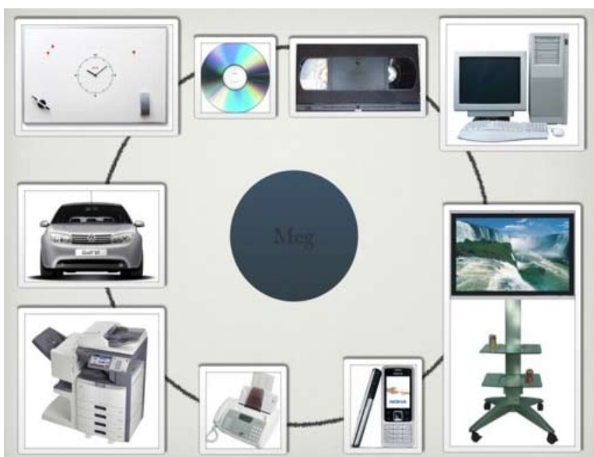
Etter mine år på Musikkhøyskolen var dette den verktøykassen jeg disponerte i 1990. Meg i sentrum, og en proksimal tangering til alle disse vektøyene. Video, CD-plater, bil, datamaskin (uten internett), whiteboard, TV (i farger og på hjul), kopimaskin, fax og en telefon (illustrert med mobil).