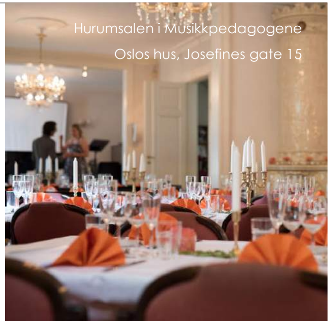
Hurumsalen i Musikkpedagogene Oslos hus, Josefines gate 15