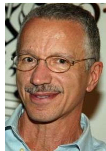
Øverst: Oscar Peterson Under: Keith Jarrett

Jeg mener dette reiser et interessant spørsmål. Innebærer 10 000 timers regelen øving i en og samme genre og på ett og samme instrument? Svaret