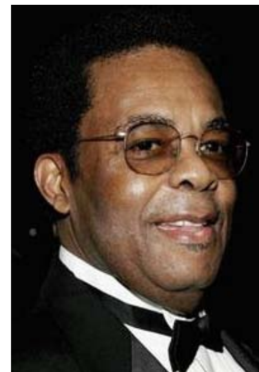
Øverst: Marc Copland Under: Freddie Hubbard