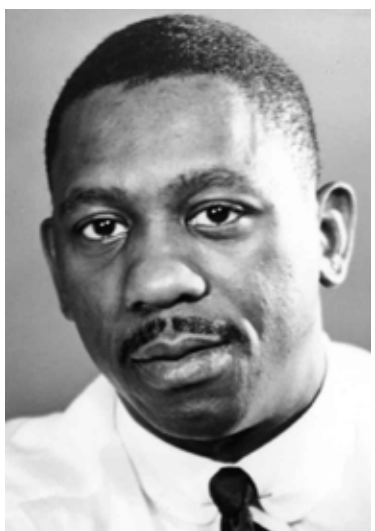
Øverst: Percsey Heath I midten: Wes Montgomery Under: Marc Copland

og trommer, men endte opp som trompetist. Freddie Hubbard var beryktet for å skifte instrument fra saksofon til piano midtveis i sine konserter (Allaboutjazz.com 2015).